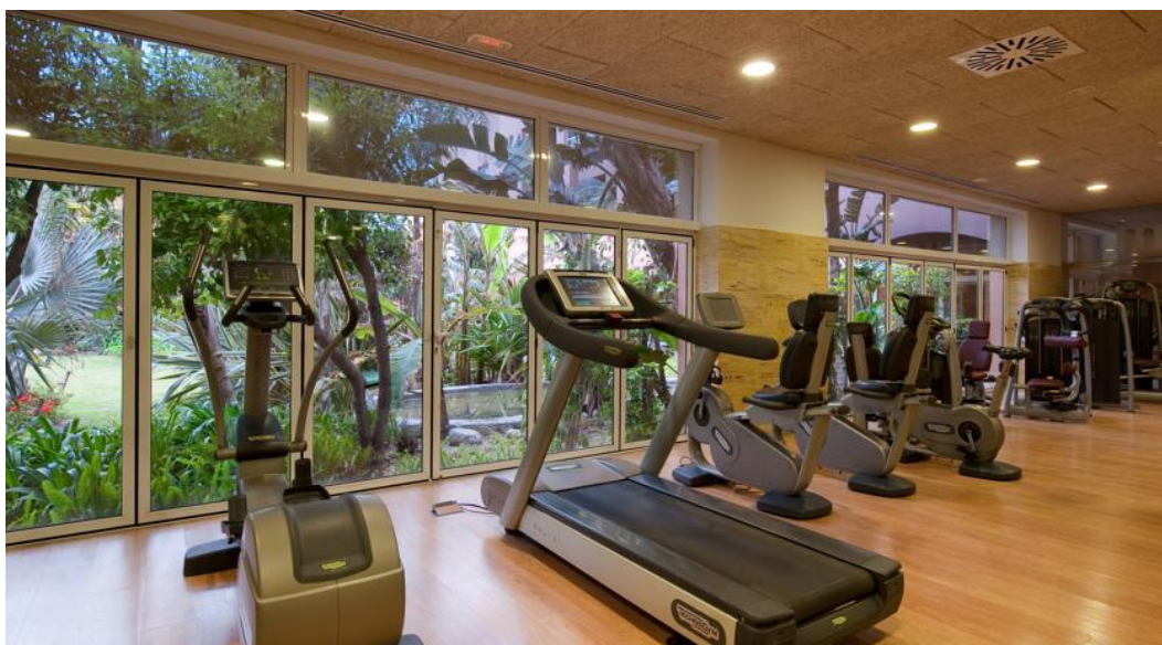
Фото зала, примерно как здесь. Лучше с занимающимися людьми.

Помимо занятий в тренажерном зале мы можем предложить вам различные оздоровительные программы с учетом возраста и состояния здоровья : массаж, индивидуальные и групповые занятия йогой, тай-чи, ци-гун и другие. Занятия проводятся как на берегу моря (утром и вечером), так и в павильоне общей площадью 500 м 2 (в случае плохой или очень жаркой погоды).