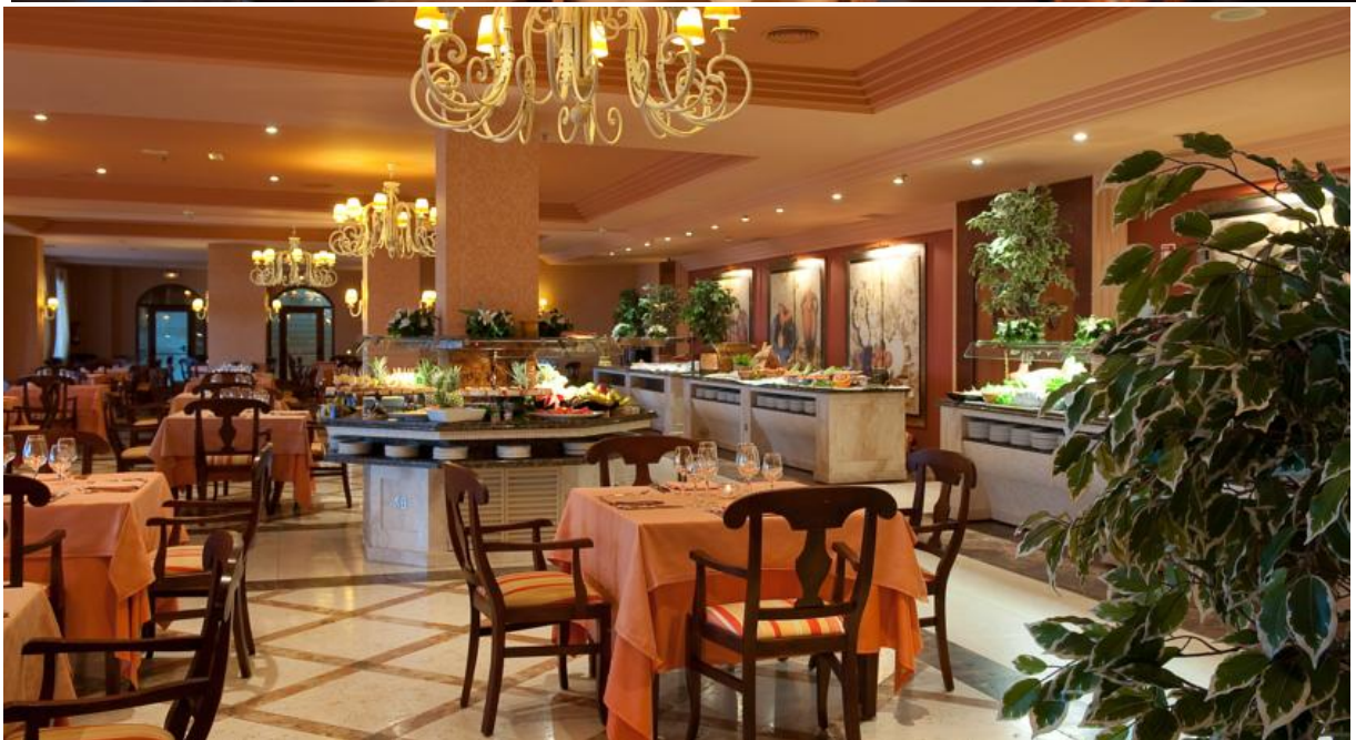
Фото как пример. Здесь тоже надо поставить слайдшоу или подборку фото. При этом заглавное фото после вашей цитаты должно отражать именно то настроение, которое Вы передали – наслаждение и безмятежность. Хорошо бы добавить в слайдшоу фотографий видов ресторана еще и красивые фото приготовленной еды