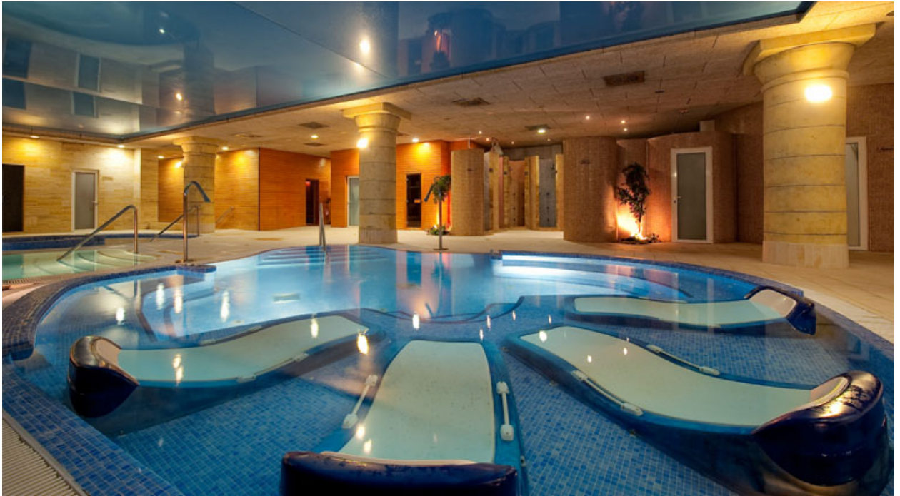
Фото СПА (лучше побольше – уж очень красивые)

Забронировать апартаменты в апартамент-отеле «Triage Dominion Beach»